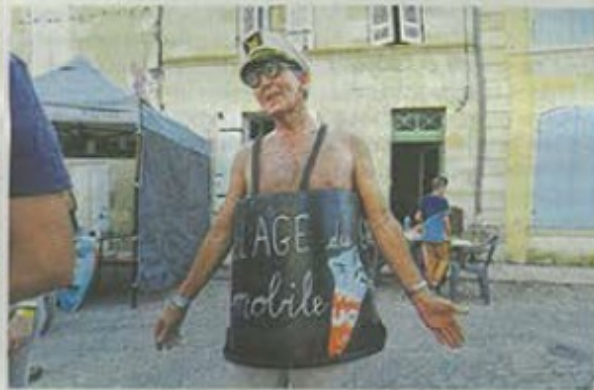
Un garde champêtre au costume particulièrement dépouillé.

pensé inviter des seniors du village en leur offrant l'entrée au festival, le repas et l'accès aux spectacles. Sept d'entre eux ont accepté cette opportunité. » Cette action s'inscrit dans le programme du bureau du CCAS qui ne se contente pas de fournir un appui sur le plan matériel mais qui se préoccupe d'offrir des distractions aux personnes pour enjoliver leur existence (on se souvient de concerts, de pièces de théâtre...).