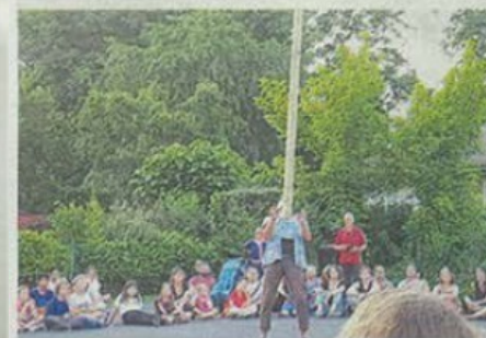
La soirée d'ouverture jeudi dernier.