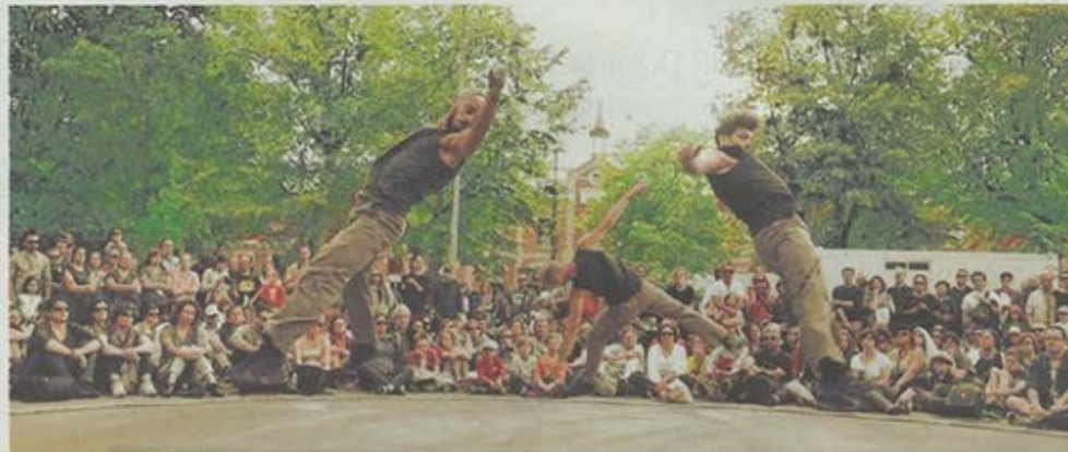
« Les Achilles », de la danse martiale par la compagnie Tango Sumo.