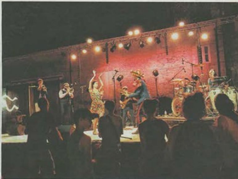
Le concert du groupe El Gato Negro, vendredi soir sur la place d'Armes.