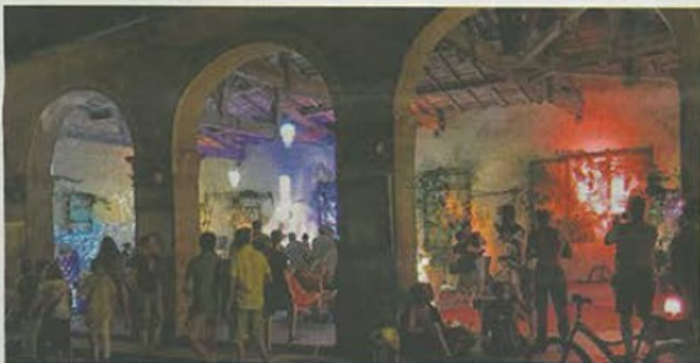
Les installations sous la halle aux petits pois.