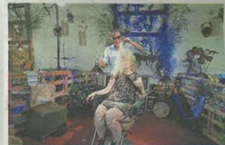
Le coiffeur officiel sous la halle magnifiquement décorée.