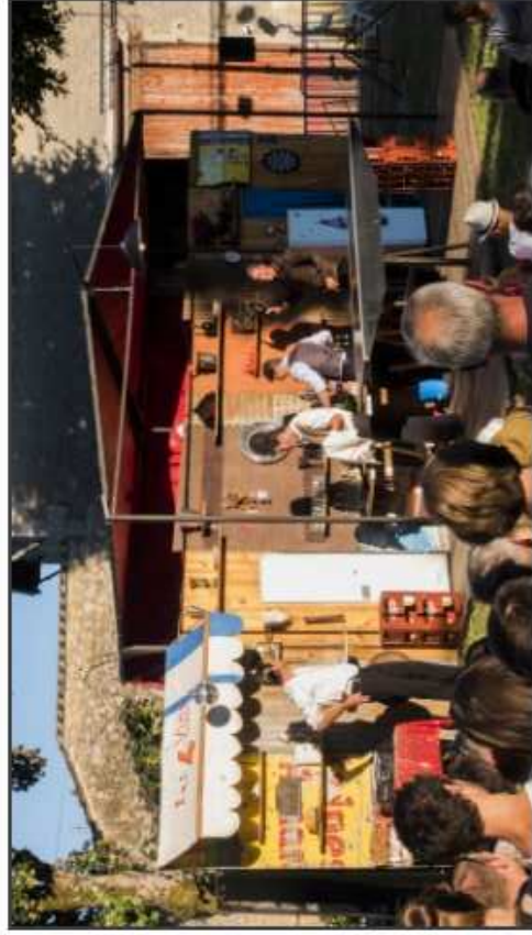
Les garçons de café à Rions

Installer les arts de rue dans le village médiéval de Rions, c'est le pari réussi de Rue & Vous qui fêtaït du 7 au 9 juillet son 10 e anniversaire. Une édition charnière puisque la Communauté de Commune qui accueille le festival va éclater l'an prochain.