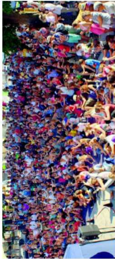
Le public est toujours venu en nombre aux rendez-vous fixés par Rues et vous. ARCHIVES

VALLON DE L'ARTOLIE Avec la disparition de la Communauté de communes, le 1 er janvier prochain, le festival vit-il ses dernières heures ce week-end ?