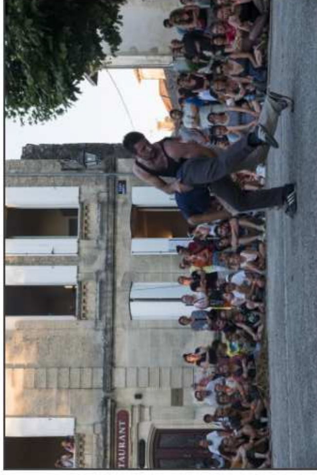
Carneros, Cie Organik à Rions

Le calendrier des discussions à venir entre les différentes CDC, autour de l'attribution des compétences et du suivi des projets en cours, se met en place pour débuter en septembre, afin que des décisions soient arrêtées en octobre-novembre. Mais le problème majeur demeure ce temps de latence avant la recomposition, qui laisse les organisateurs dans l'expectative.