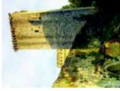
La citadelle de Rions va vibrer de mille feux. AGO-RUES.G.H.

Vendredi, dès 18 h 30 et jusqu'à point d'heure, les rues et les places du village vont s'animer de multiples attractions et spectacles dignes des meilleurs festivals des arts de la rue. À 18 h 30 et 20 h 45, place Jary, la compagnie Mine de Rien (théâtre participatif) jouera « Cendrillon mène le bal » (dès 5 ans). Les Compagnons de Pierre Ménard (théâtre musical, mime, langue des signes) interpréteront « Goupil » à 19 h 15, place du Repos (dès 6 ans). À 20 heures, sur la place d'Armes, ce sera au tour de Gérard Naque de développer théâtre et magie dans le « Presqu'Idigitateur » (dès 7 ans). Puis, à 20 h 30, Parco de la compagnie Spectralex, développera son théâtre burlesque et clownesque place Cazeaux-Cazaliet (dès 7 ans). La grande déambulation dansée partira à 21 h 30 devant l'église,