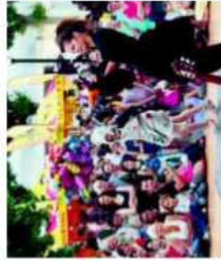
Mine de rien : un spectacle plein d'énergie et d'humour en interaction directe avec le public.

SAMEDI Dans les rues et places du village. Olof Zinou (théâtre et cirque de rue) à 17 h 45 et 20 heures, place d'Armes. Compagnie Spectralex à 18 h 15 et 19 h 45, place du Repos et à 21 h 15, place Jary. Compagnie Organik (danse animale)