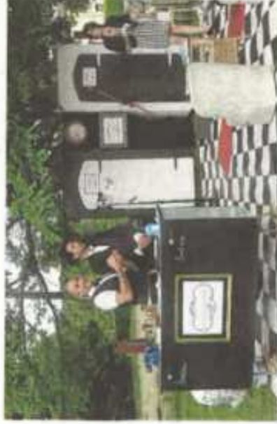
« La Grosse Commission » en continu sur la place d'Armes.

Samedi 9 juillet : à 17h45 et 20h, place d'Armes, « Les Gar-