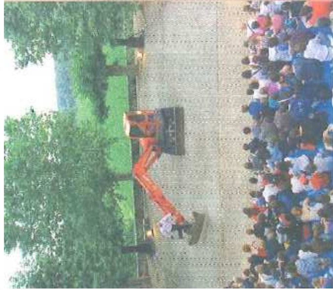
Festival Rues et Vous, les 5 et 6 juillet, Rions, www.festivalruesetvous.net