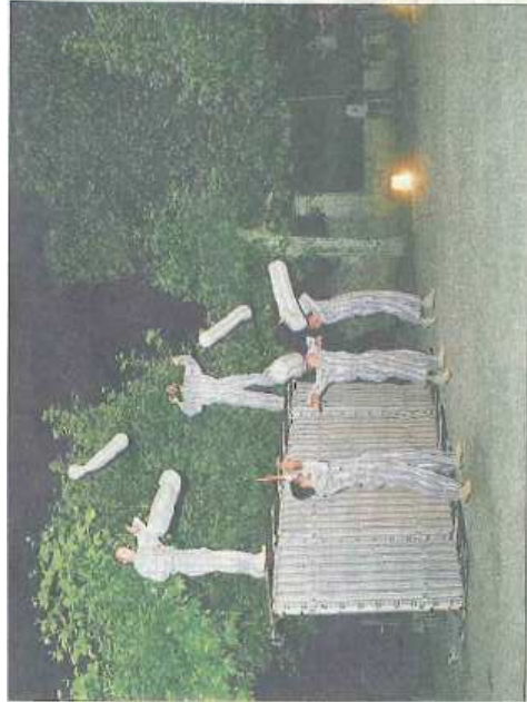
Chorégraphies hallucinées, prouesses acrobatiques : gros succès de l'« Expédition Paddock » de la Cie Tango Sumo