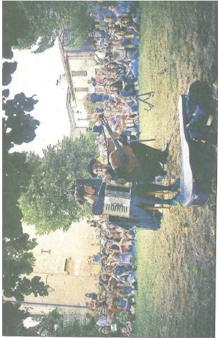
Ambiance familiale à Rions pour le festival Rues et Vous.