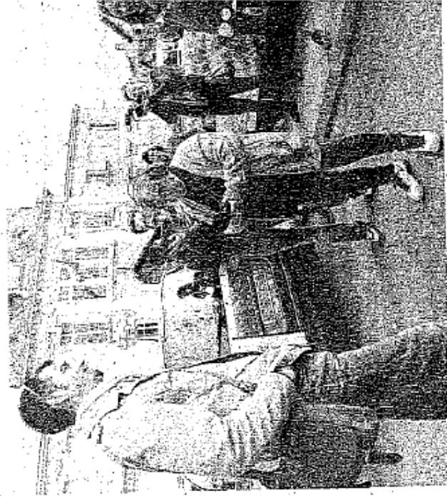
Des cameramen amateurs avec un matériel professionnel.