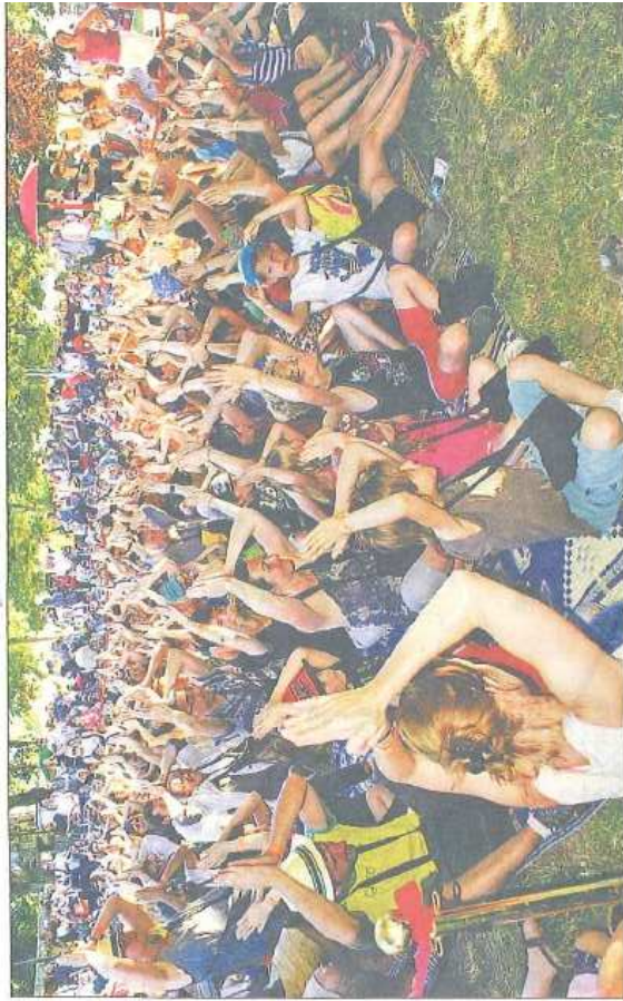
Bon enfant, le public a été aussi acteur de ce festival.