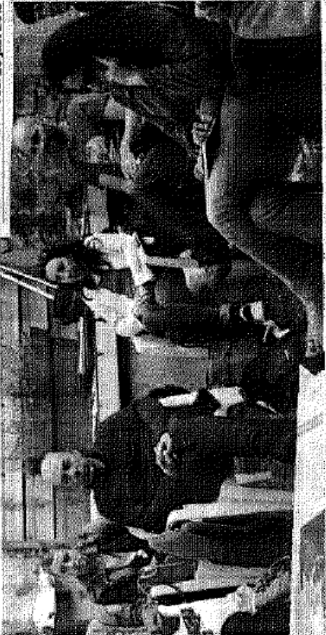
Rassemblement des bénévoles de Musaraigne dans la cour du Cerdic rénové.