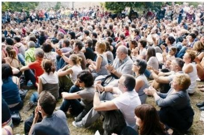
Gros succès populaire d'année en année.

Vingt compagnies ou groupes de musique, théâtre, danse, arts de la piste, sont présents pour 44 représentations sur deux jours. Plus de 5 000 personnes sont attendues.