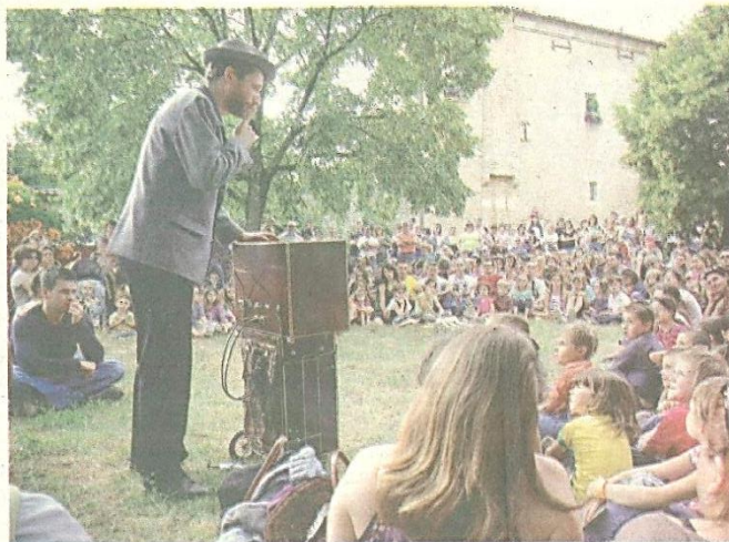
Festival familial par excellence, le festival Rues et Vous attirent tous les ans de nombreux visiteurs.

La simplicité est de bon aloi, l'essentiel étant de «se faire plaisir», d'écouter battre le cœur de Rions. Abandonnez votre voiture dans un parking extérieur et regagnez le centre. Et là, oh surprise! La ville bruisse à chaque coin de rue, sur chaque place, des airs de musiques variées éveillent les façades de pierre, des drôles