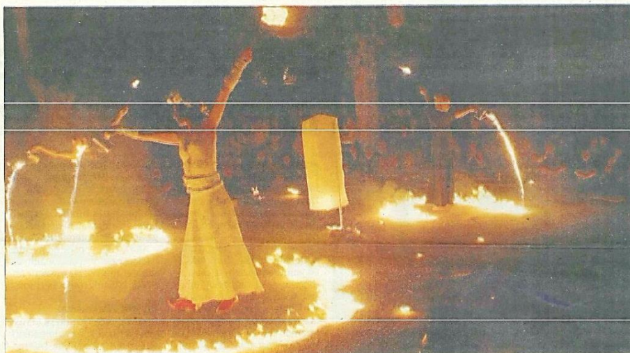
Le final époustoufflant avec Les Filles d'Hestia