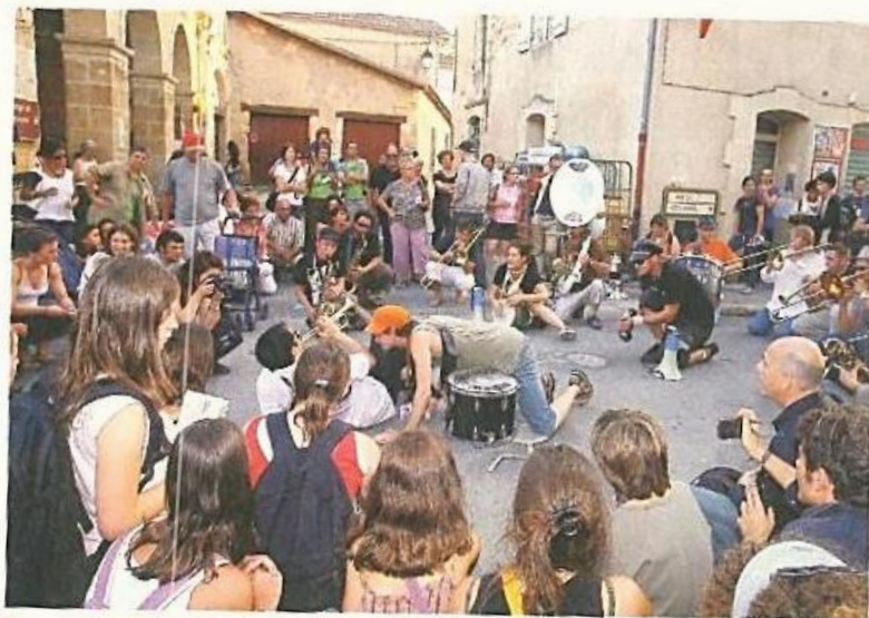
Les spectacles de rue, c'est la spécialité du festival «Rues et Vous».