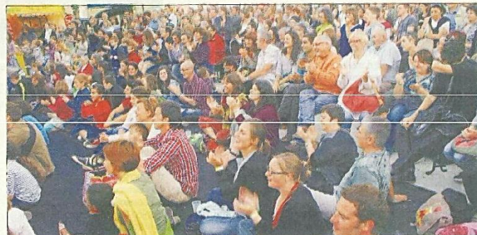
En haut, voyage au Brésil avec Samba Tudo ; à droite, instants magiques avec la compagnie Bivouac. En bas à gauche, la compagnie La Renverse à fait participer directement le public qui s'est pressé en nombre (à droite) à chacun des spectacles