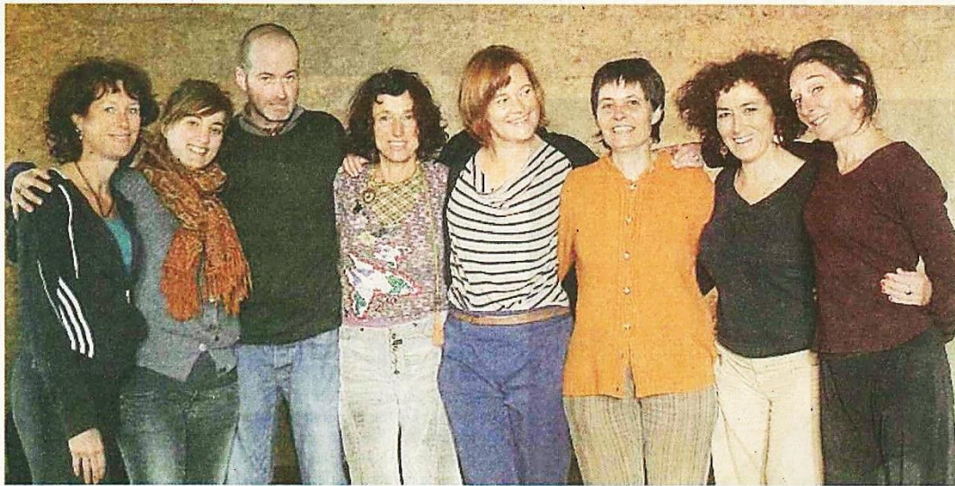
Ils vous attendent, les premiers membres de l'OCNI.