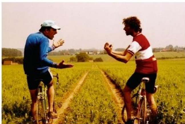
Dans «Velodroom», les Belges V-Man et V-Boy organisent une course cycliste sous chapiteau.

Beau mariage entre une programmation des arts de la rue et un village, Rues et Vous est plus que la somme de ses parties. Et c'est parti, aujourd'hui et demain à Rions.