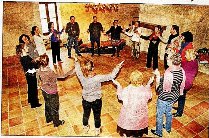
Déroulement d'un atelier à la tour du Lhyan.