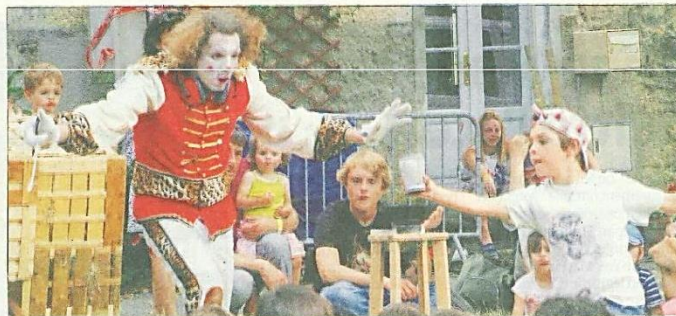
À gauche : les Kags, deux voix pour un récital « délyrique ». À droite : les enfants étaient tant acteurs que spectateurs. REPORTAGE PH. CTO. GILBERT HABATJOU