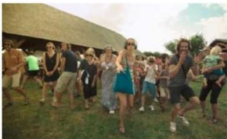
« Ballad » par OxypuT. RUES ET VOUS