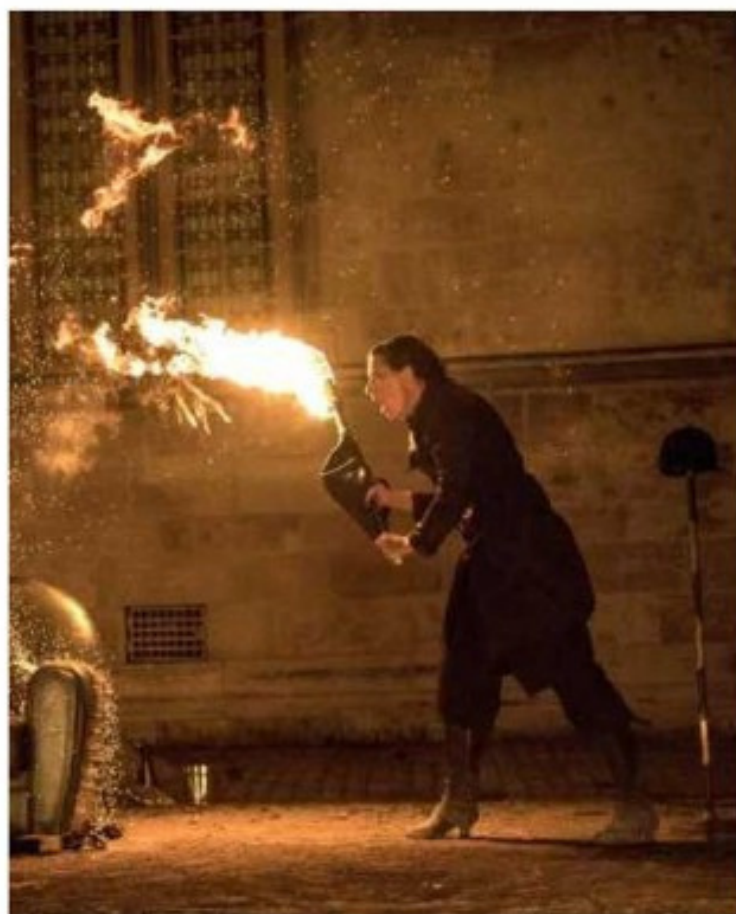
« Amor » par Bilbobasso, un spectacle danse et feu. J.-C. CHAUDY

Édition allégée et simplifiée pour Rues et Vous. Qui garde quand même le cap de la qualité dans l'espace public et d'une vibration particulière