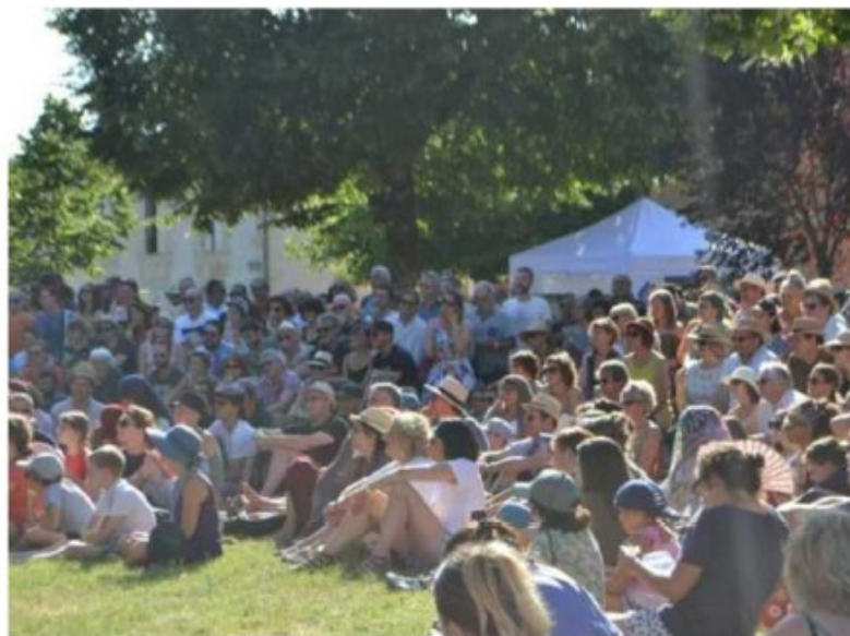
Événement populaire, Rues et Vous draine chaque année beaucoup de monde.