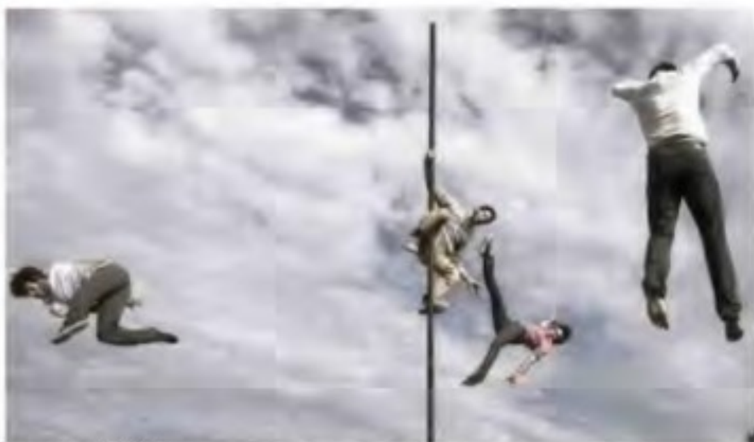
La compagnie Kiaï.