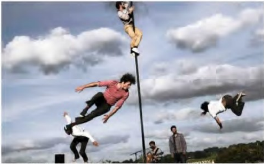
La compagnie Kiaï tutoie les hauteurs et titille les scènes nationales.