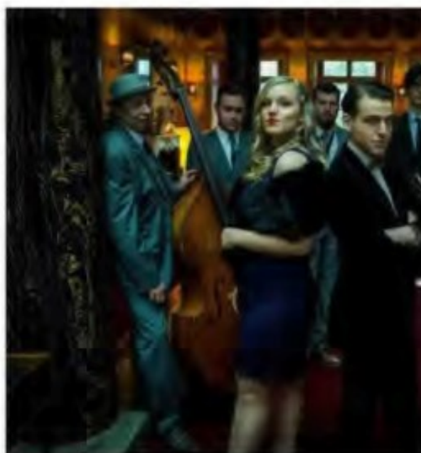
Galaad Moutoz Swing Orchestra.