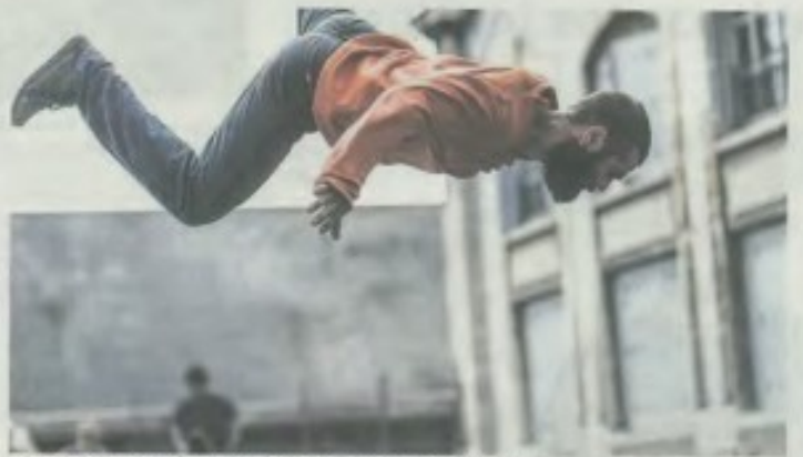
Le spectacle « BOI » de la cie Galapiat Cirque/Jonas Seradin.

dies / Foutrack Deluxe / Los dos hermanos