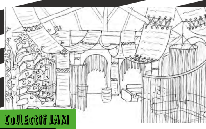
Collectif JAM [La Halle dorée]