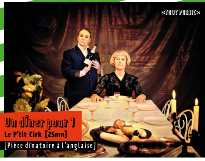
Un dîner pour 1 Le P'tit Cirk [25mn] [Pièce dinatoire à l'anglaise]

DImanChe 9 // Visite #1 - 14h00 Visite #2 - 16h00 // Départ Eglise