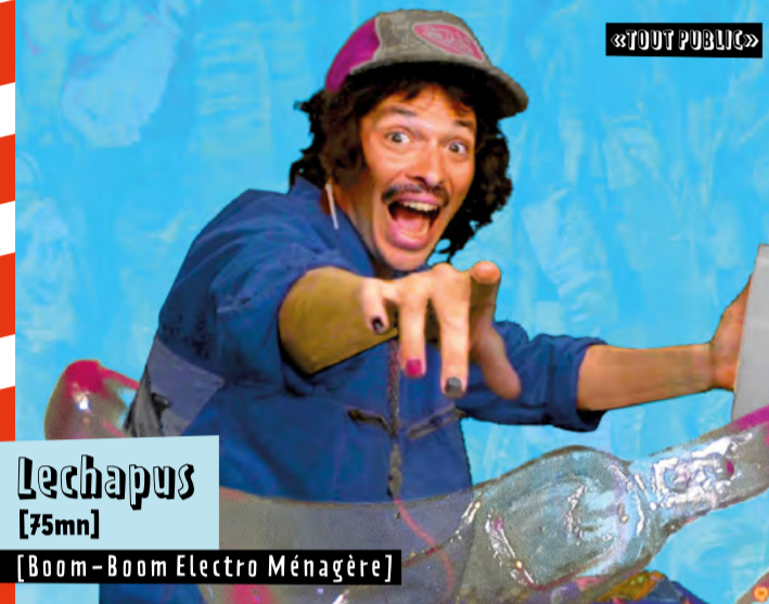
Lechapus [75mn] [Boom-Boom Electro Ménagère]

À partir de 20h, rendez-vous place du Repos au cœur du village, pour une ouverture musicale électro et une restauration aux saveurs d'ici et d'ailleurs !