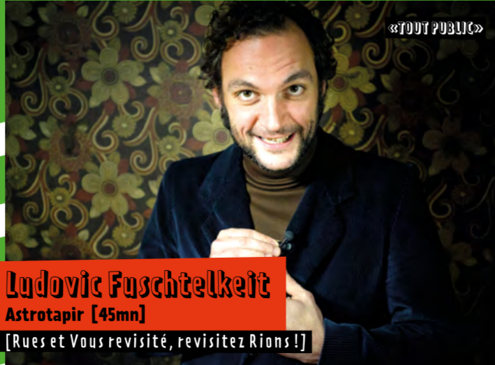
Ludovic Fuschtelkeit Astrotapir [45mn] [Rues et Vous revisité, revisitez Rions !]

DImanChe 9 // 13h00 pique-nique électro 14h30-17h00 coiffures électroniques // Place d'Armes