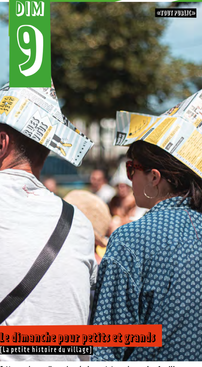
Le dimanche pour petits et grands [La petite histoire du village]