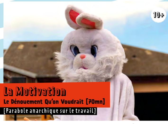
La Motivation Le Dénouement Qu'on Voudrait [70mn] [Parabole anarchique sur le travail]

Alice est nouvelle recrue dans une entreprise de service d'orientation de carrière. Guidée par un lapin blanc, elle s'interroge sur nos motivations à consacrer deux tiers de nos vies éveillées à l'emploi. Elle analyse et ré-enchantre les finalités du travail et prend le parti d'en rire.