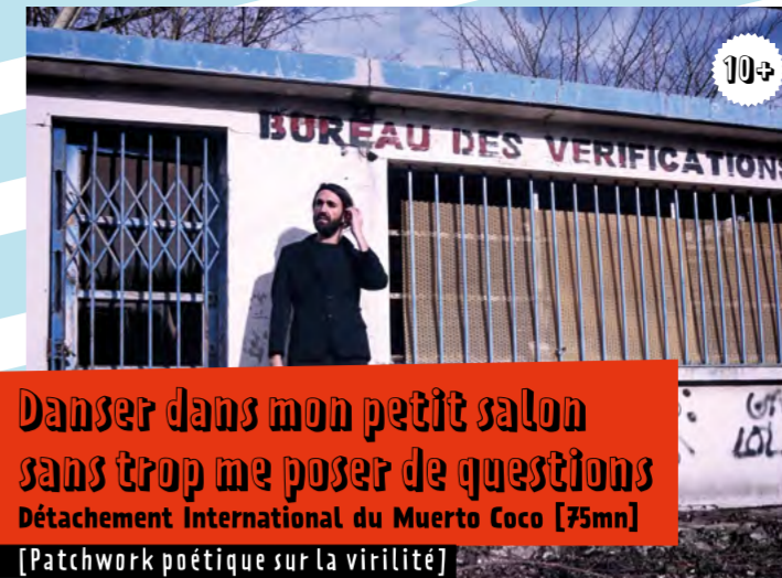
Danser dans mon petit salon sans trop me poser de questions Détachement international du Muerto Coco [75mn] [Patchwork poétique sur la virilité]

SAmeDi 8 // 18h45 et 21h15 // Place d'Armes