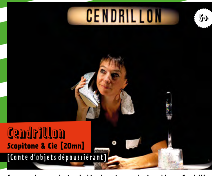
Cendrillon Scopitone & Cie [20mn] [Conte d'objets dépoussiérant]

DImanChe 9 // 14h15 & 15h15 & 16h15 // Citadelle