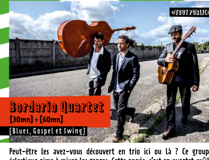
Bordario Quartet [30mn] + [60mn] [Blues, Gospel et Swing]

DImanChe 9 // 14h15 & 15h45 // Jardin du Couvent