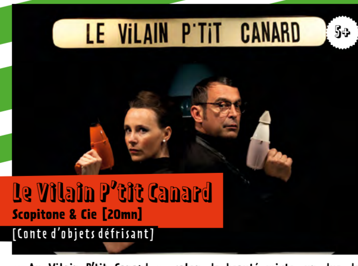
Le Vilain P'tit Canard Scopitone & Cie [20mn] [Conte d'objets défrisant]

DImanChe 9 // 14h30 & 15h30 & 16h45 // Cour du Cercle