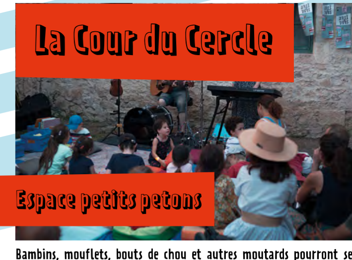
Espace petits petons

SAmeDi 8 // 22h00 // Place Cazeaux Cazalet