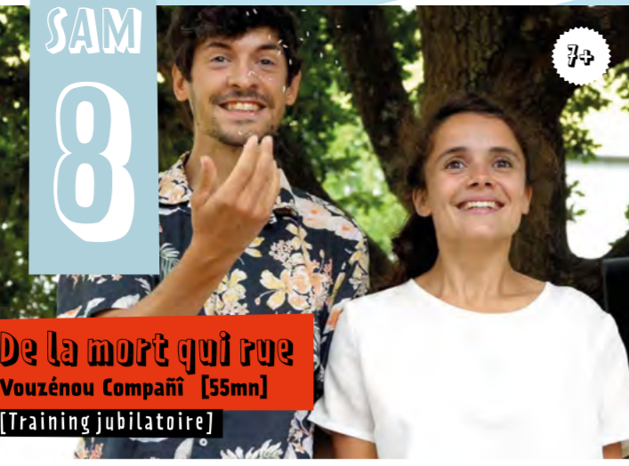
De la mort qui rue Vouzénou Compañi [55mn] [Training jubilatoire]

« On n'aura droit qu'à une seule mort, chacun la sienne, alors autant commencer à s'y entraîner tout de suite, non ? ». Faire de la mort une discipline pour laquelle on pourrait s'exercer comme un sportif de haut niveau... Pour être paré du mieux quand le grand jour arrivera.